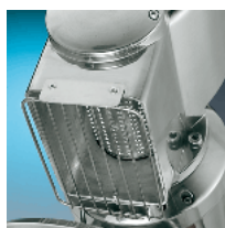
Protection grate / standard s/steel drum