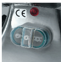
Optional push-button panel with reverse