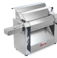
Sansone 42 with optional pasta cutter